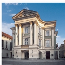
STAVOVSKÉ DIVADLO THE ESTATES THEATRE Ovocný trh, Praha 1