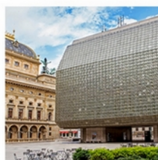
NOVÁ SCÉNA THE NEW STAGE Národní 4, Praha 1