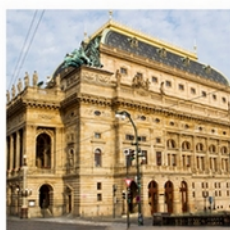
NÁRODNÍ DIVADLO THE NATIONAL THEATRE Národní 2, Praha 1

Národní divadlo, Ostrovní 1, 112 30 Praha 1; IČ: 00023337; DIČ: CZ00023337. Plnění je osvobozeno od DPH. The sales are exempt from VAT.